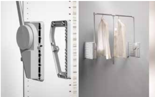
Distanz - 20 mm